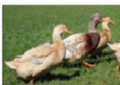
Rouen / Sachsen