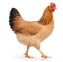
Grünleger (verschiedene Farbchläge)