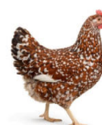
Blumenhuhn / Tricolor