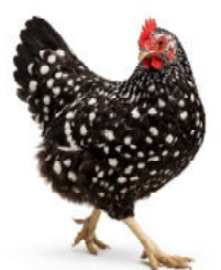
Blumenhuhn / Dalmatiner